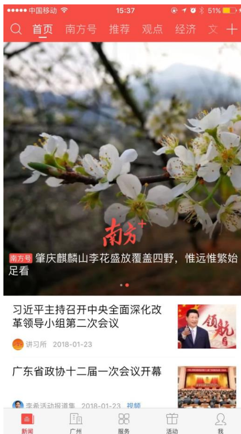
首页等其他订阅频道